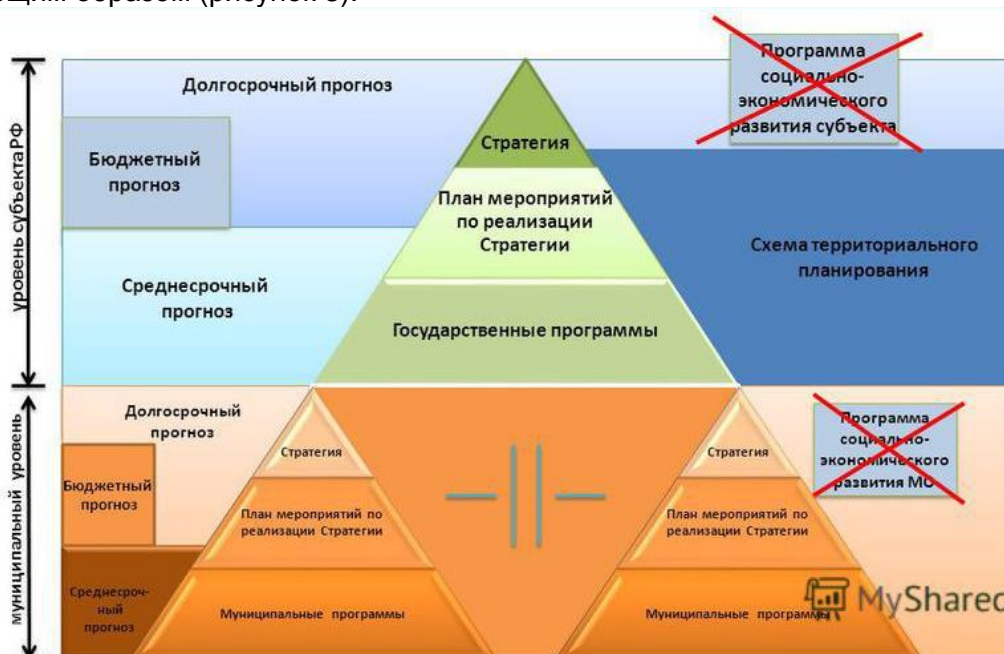
Рисунок 3 – Система стратегического планирования Орловской области

На уровне субъектов Российской Федерации система стратегического планирования разрабатывается в соответствии с собственной трактовкой требований федерального законодательства. Так, система стратегического планирования Орловской области в рамках реализации Федерального закона № 172-ФЗ от 28.06.2014 г. «О стратегическом планировании в Российской Федерации» выглядит следующим образом (рисунок 3).